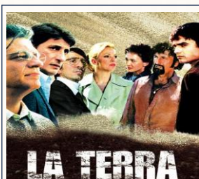
LA TERRA (2006) di Sergio Rubini

Giovedì 23 Luglio 2026 LUOGO: Piedicolle