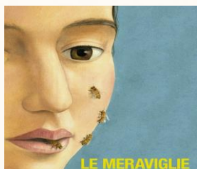
LE MERAVIGLIE (2014) di Alice Rohrwacher